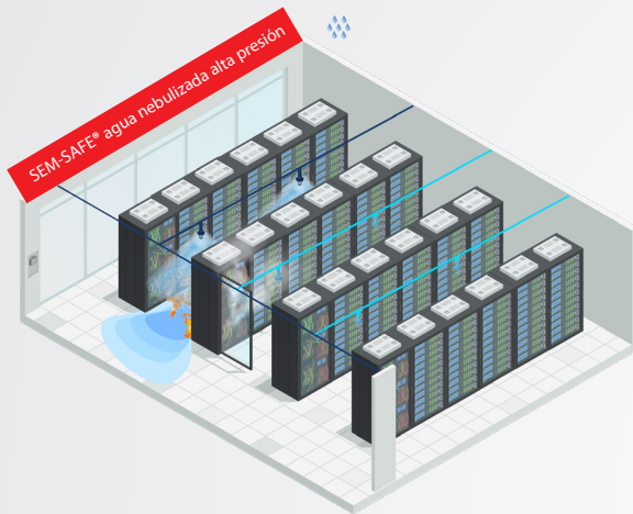
SEM-SAFE® agua nebulizada alta presión(HPWM)